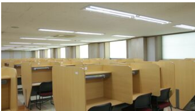
법학학술정보관 열람실