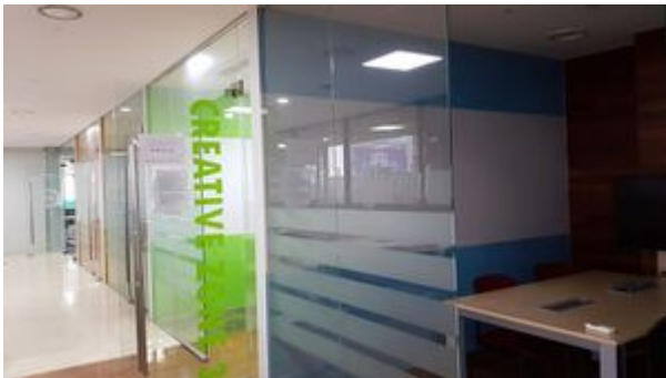
3층 Creative Zone

팀원들과 모여 이야기를 나눌 수 있는 공간이다. 백남학술정보관 에는 3개 층에 그룹스터디룸이 나뉘어 분포하고 있다.