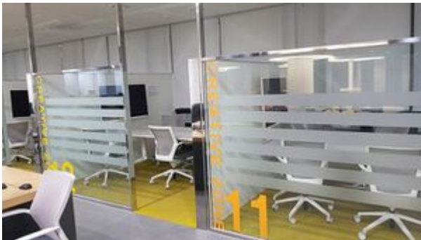
이종훈 라운지 Creative Zone