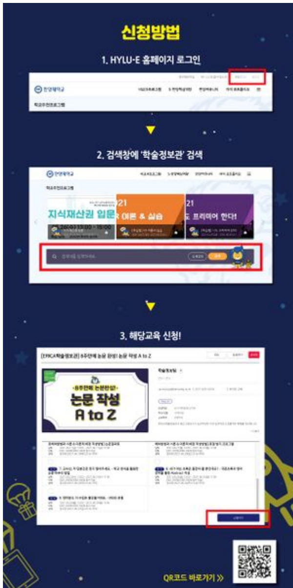
논문작성 프로그램 신청방법