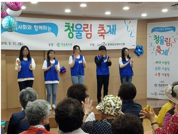
• 청올림 축제 봉사