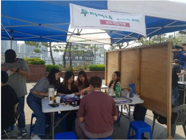
• 동아리 부스 운영