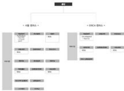
〔그림 1-3-4〕 부속기관