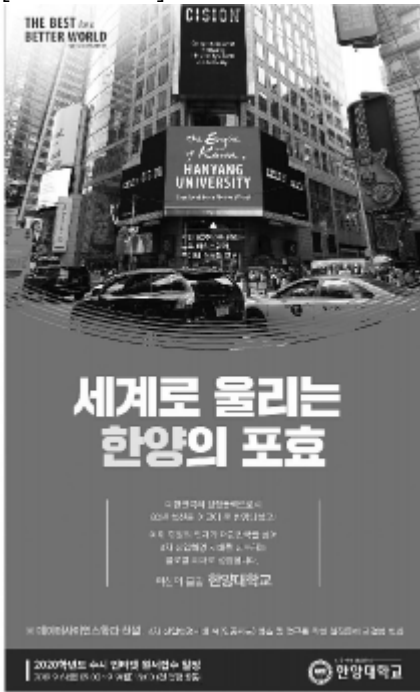
[그림 3-10-4] 2018년 대학광고