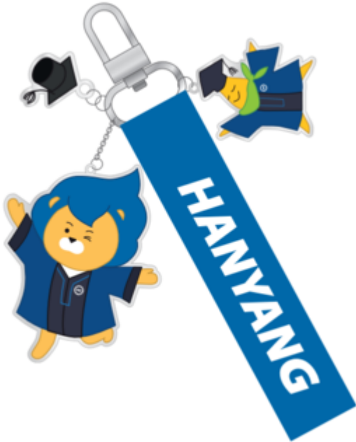
아크릴 스트랩 키링 (학위복 ver.) (©디자인경영센터)