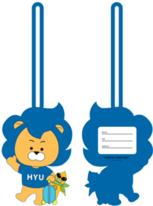
실리콘 네임택