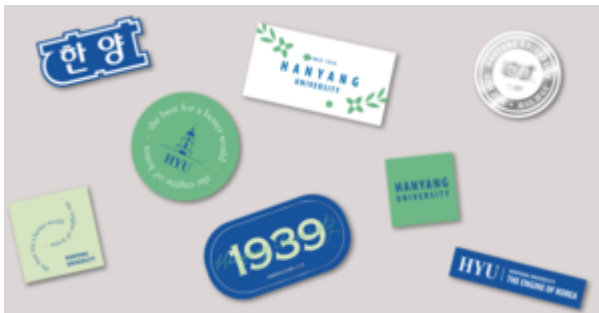
로고 스티커팩