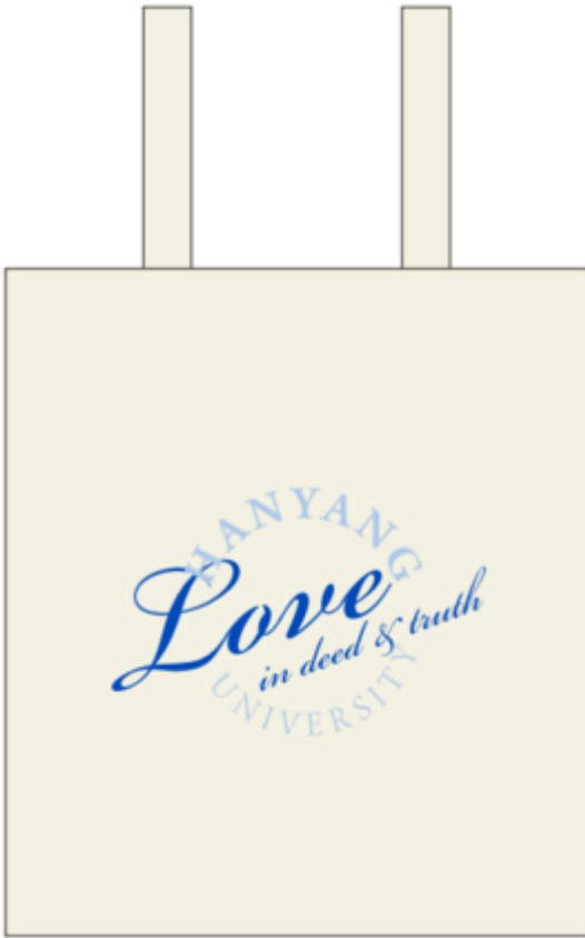
에코백_사랑의 실천 (©디자인경영센터)