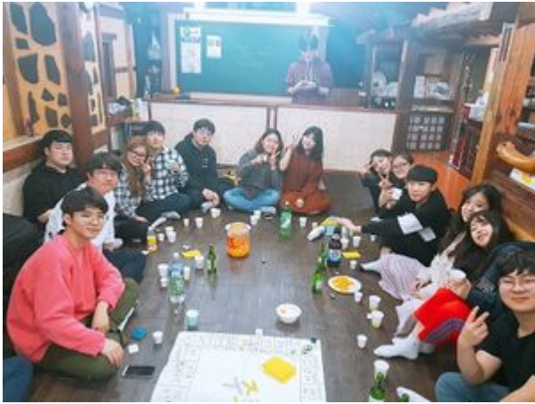
샤르만트 신입생 MT

는다는 것이다. 기타가 있기 문! 밤에 듣는 클래식 기타 소리만큼 낭만적인 것이 없다.