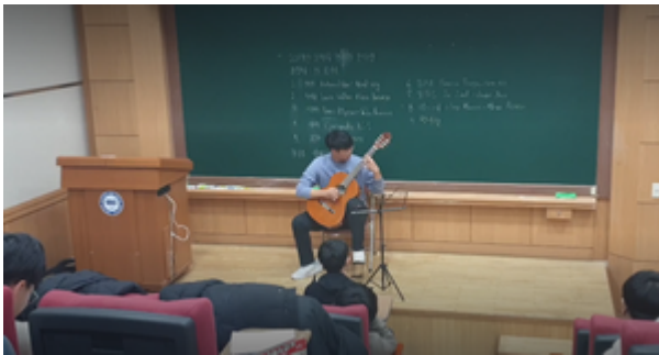
샤르만트 2019-2 정회원 오디션