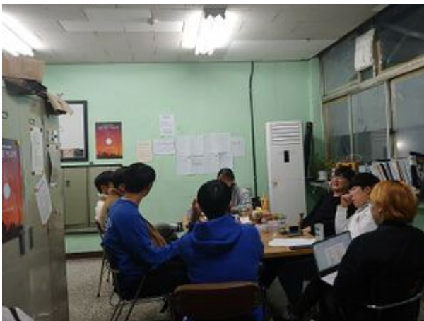
샤르만트 제89회 임원단 회의 모습(2019-2)