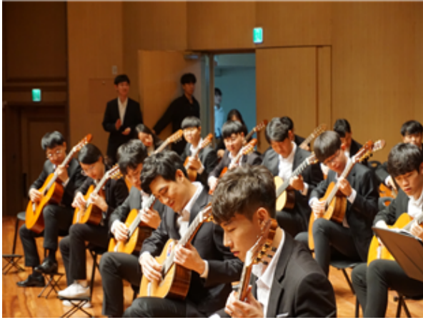
대부분 동아리 소유 기타