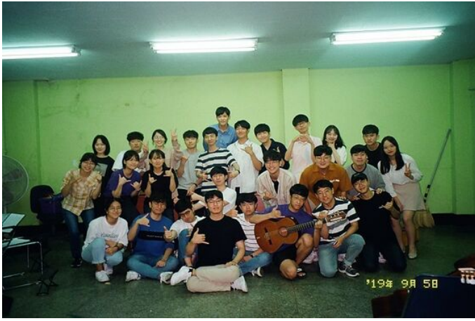
• 제41회 가을연주회 합주단원