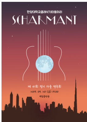
제 41회 정기 가을 연주회 포스터