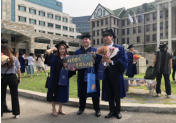
샤르만트 졸업생 환송회

샤르만트에서 함께 활동했던 졸업생들을 축하해주는 행사이다. 동아리원이라면 누구든지 참여할 수 있으며, 축주를 동반한 환송회 식사가 진행된다.