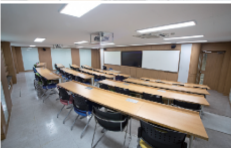
ERICA 제1공학관 건물 내부 이미지 공학대학 행정팀: 031-400-5118