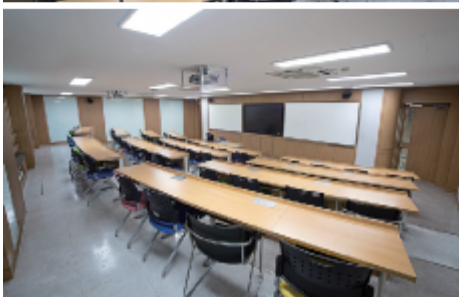
ERICA 제1공학관 건물 내부 이미지 공학대학 행정팀: 031-400-5118