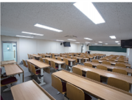
ERICA 제2과학기술관 건물 및 내부 이 미지