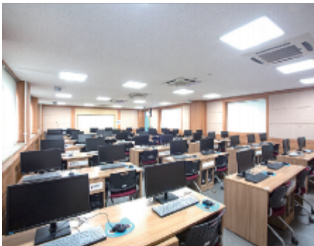
ERICA 제4공학관 건물 및 내부 사진