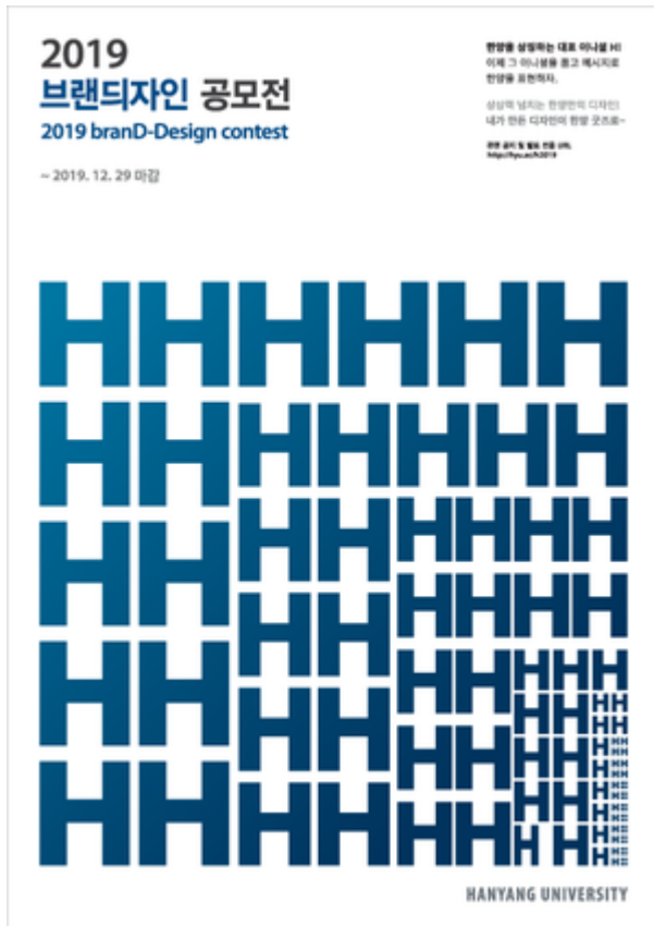
제1회 한양브랜드디자인 공모전 포스터

한양인 구성원들의 참여를 통해 대학의 고유 브랜드를 위한 디자인을 공모하는 이벤트로, 미디어전략센터 와 디자인경영센터 에서 진행한다. 2019년 12월 첫 시행