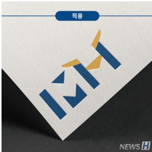
제1회 한양브랜드디자인 공모전 은상(문진명)2.jpg