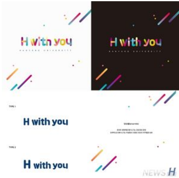
제1회 한양브랜드디자인 공모전 은상(박소영).jpg