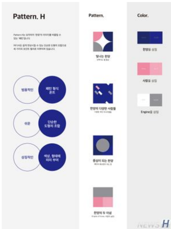
제1회 한양브랜드디자인 공모전 금상(김지민)1.jpg