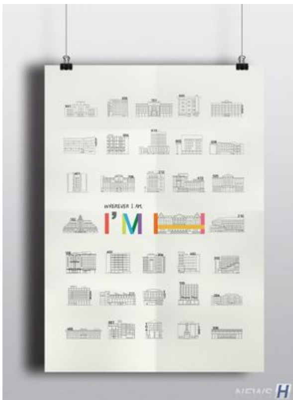
제1회 한양브랜드디자인 공모전 대상작2.jpg