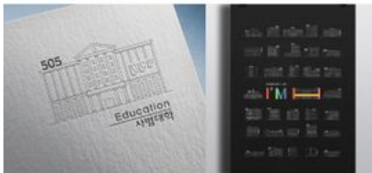
제1회 한양브랜드디자인 공모전 대상작1.jpg