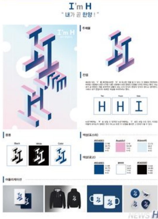
제1회 한양브랜드디자인 공모전 금상(오하경).jpg