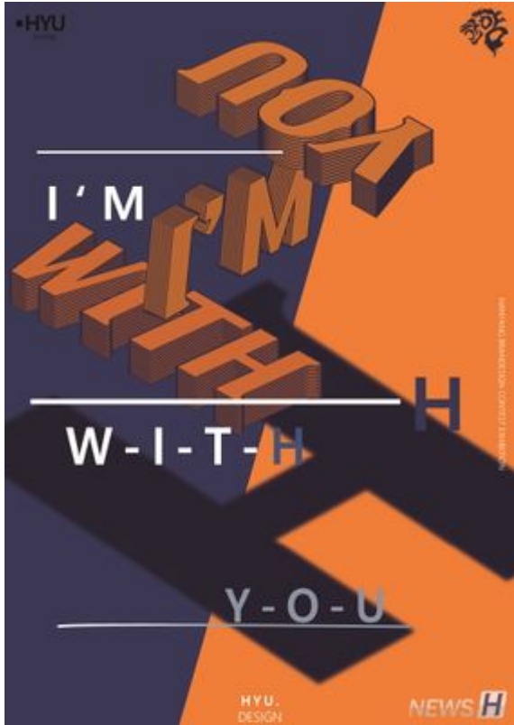
제1회 한양브랜드디자인 공모전 은상(한채정).jpg