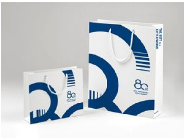
80주년 기념 쇼핑백 타입A