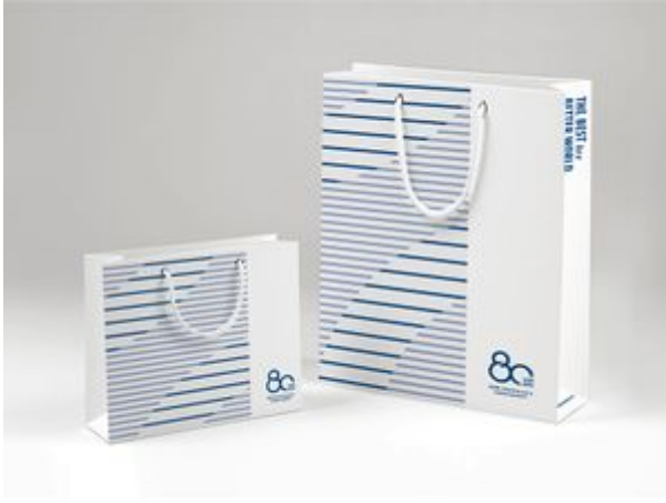
80주년 기념 쇼핑백 타입B