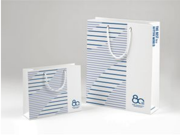
80주년 기념 쇼핑백 타입B