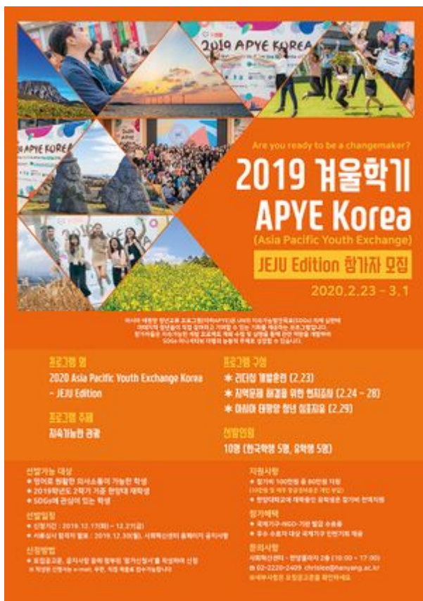
APYE JEJU 모집 포스터

APYE Korea - JEJU Edition은 여름에 진행되는 APYE Korea의 수요증가에 따라 좀 더 많은 청년들의 참여기회를 제공하기 위한 시작의 일환으로, 수려한 관광자원을 보유한 관광특구 제주도에서 “지속가능한 관광”이라는 주제로 진행