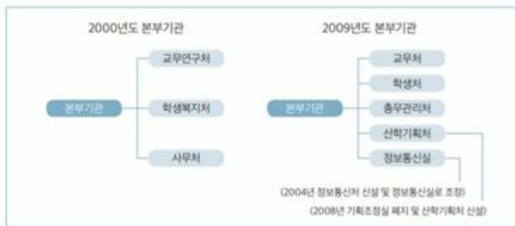
• 2000년도와 2009년도 본부기관의 비교